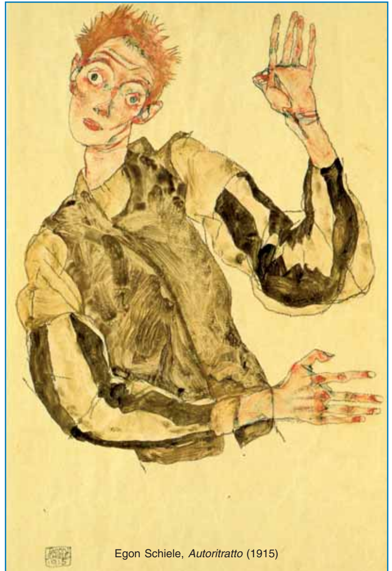
Egon Schiele, Autoritratto (1915)

Anziché far diventare la nostra salute, la nostra intelligenza, la nostra fede un punto di partenza per la nostra autodistruzione proviamo a seguire i consigli di un uomo a cui la vita non ha regalato nulla, ma che ha saputo conquistarsi la saggezza e la bontà da distribuire a piene mani; un uomo che considera la debolezza una ricchezza perché, come afferma lui stesso: "Al cuore della mia debolezza posso apprezzare il dono della presenza dell'altro e offrirgli la mia umile presenza".