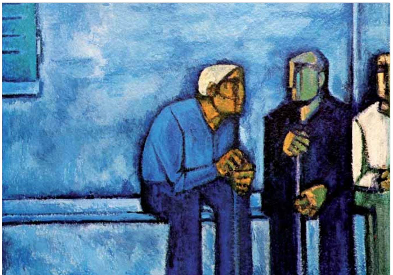
Domenico Cantatore Tre uomini