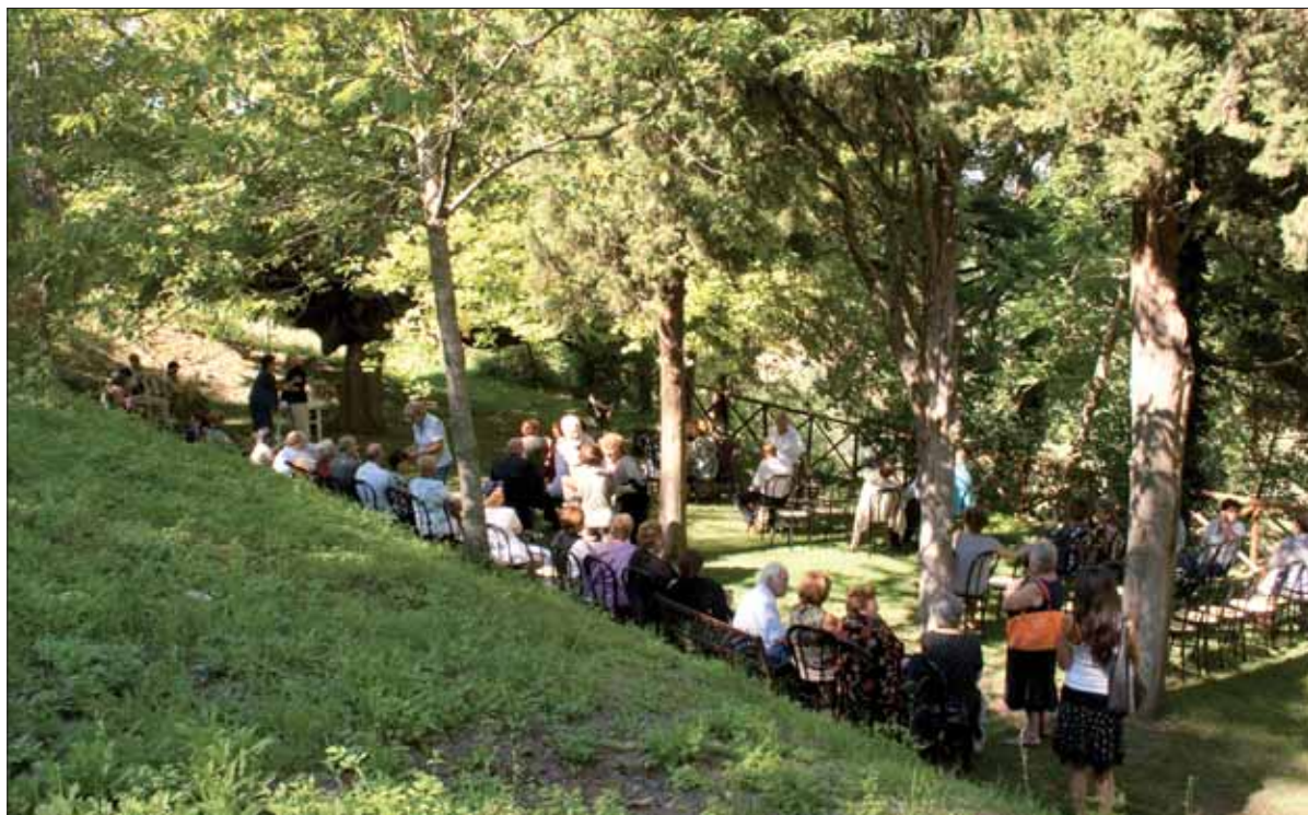
Il gruppo di Pieve Torina a Galliano l'8 agosto 2010

no. Se il dolore per la sua scomparsa è stato tanto grande voleva dire che l'anima era docile al volere del Creatore ed alle Sue finalità, molto simile al "Fiat" della Madonna all'annuncio dell'Angelo.