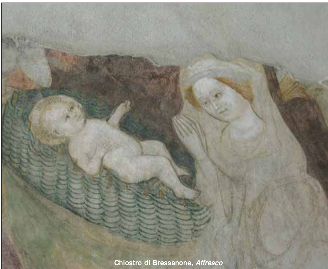
Chiostro di Bressanone, Affresco

Il Dio Bambino, “accolto nel cuore con amore, cambia la vita, cambia la storia, cambia l'eternità”.