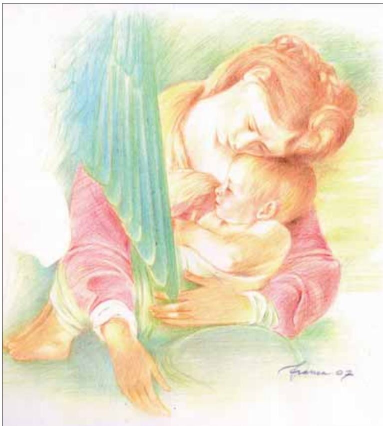
Disegno di Franca Mettica

Ho letto ieri tornando dal lavoro del turno 14 -22 (faccio turni anche di notte) alcune lettere di Benedetta. La cosa che è palese, e di riflesso anche io ne sono stato contagiato, è la forza che emanano le sue